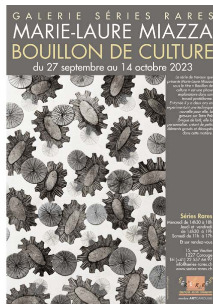
Format 42x30 cm Format 30x21 cm